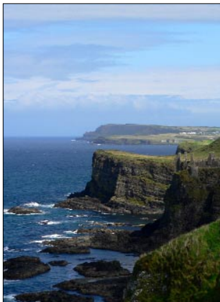
Eindrucksvoll: Giant's Causeway

Pressefotos zum direkten Download unter http://www.mundo-presse.de/fotos_zr.html