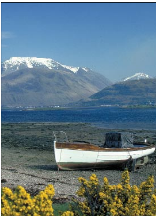
Auf dem Whisky Trail

Pressefotos zum direkten Download unter http://www.mundo-presse.de/fotos_zr.html