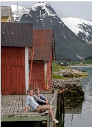
Genießen in Norwegen

Pressefotos zum direkten Download unter http://www.mundo-presse.de/fotos_zr.html