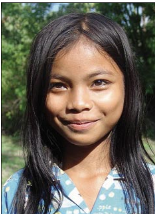
Jeder Reisende hilft