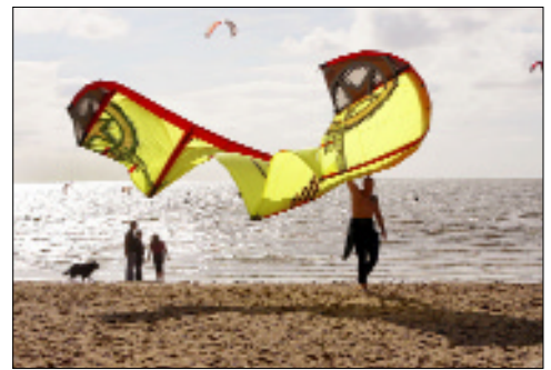
Wind- oder Kitesurfer finden im Nordseeheilbad beste Bedingungen