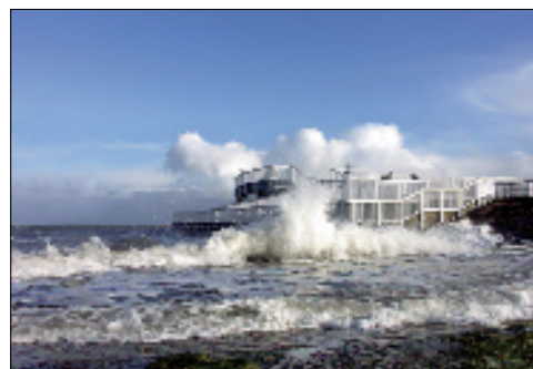
Berühmte Aussichtsplattform in Cuxhaven: „Alte Liebe“