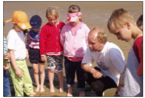
Kindern die Welt des Meeres erklären: im „Blauen Klassenzimmer“