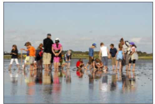
Das Wattenmeer hautnah kennen lernen: Führungen im Watt