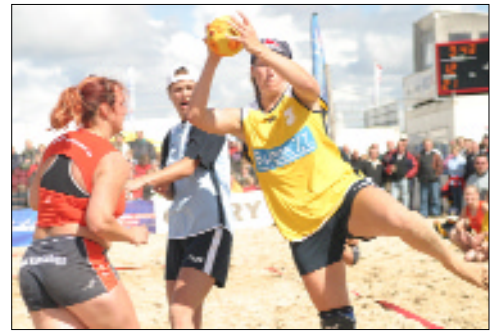
Einziges permanentes Beachstadion an der Nordsee: Stadion am Meer