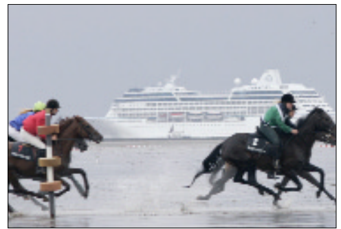
Neuer Termin: das Duhner Wattrennen findet 2010 am 8. August statt