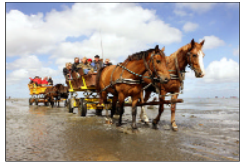
Riesenpaß für Groß und Klein: mit dem Pferdewagen durchs Watt