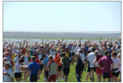
Highlight des Nordseelaufs: die Watt- etappe von Neuwerk bis Cuxhaven