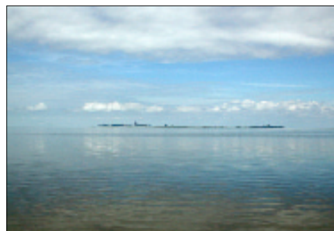
Direkt vor Cuxhaven liegt die kleine Insel Neuwerk im Wattenmeer