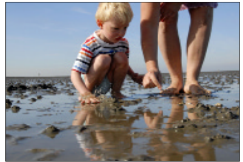
Familienfreundlich: Urlaub im Nordseeheilbad