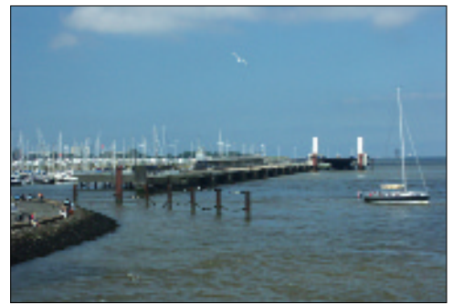
Cuxhaven: vielseitiges Segelrevier