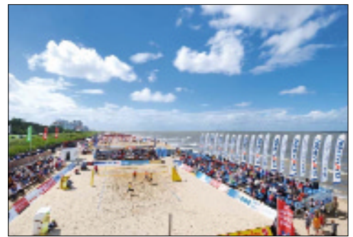
Beachvolleyball-Training für jedermann gibt es von Juni bis August