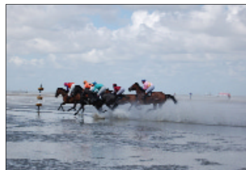
2010 zum 33. Mal in Folge: Duhner Wattrennen