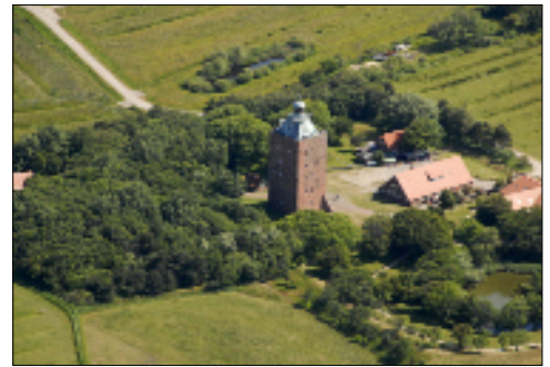
Vom 45 m hohen Leuchtturm lohnt der Blick über die Insel und das Meer