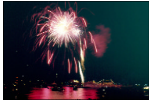
Sommerabend am Meer mit imposantem Höhenfeuerwerk