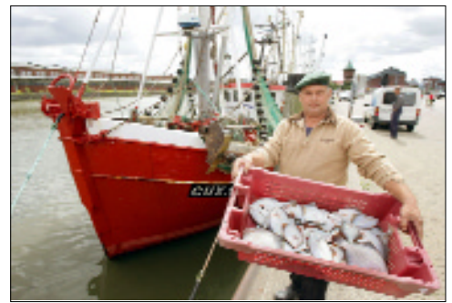
33. Deutscher Seeschiffahrtstag: 2010 im Hafen von Cuxhaven