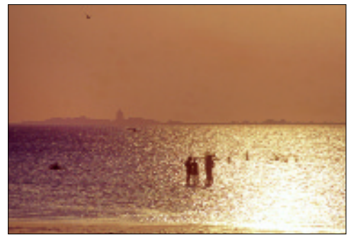
Wunderwerk der Natur: das Wattenmeer