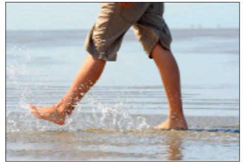
Macht gesund und schön: Klimawandern am Meer