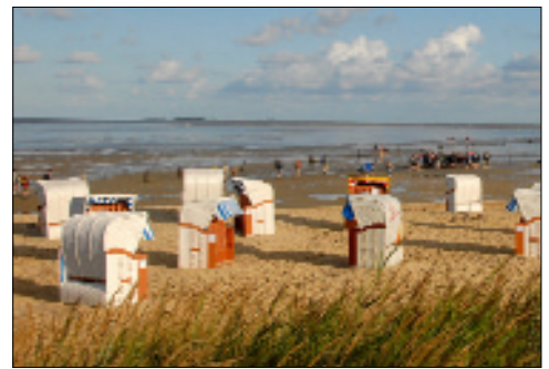
Einstimmen auf Urlaub: neuer Internetauftritt Cuxhaven