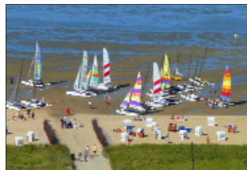
Segelkurse auch fürs Katamaransegeln werden in Cuxhaven angeboten