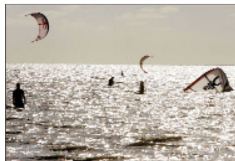
Kiteschulen bieten Kurse für Anfänger und Fortgeschrittene an